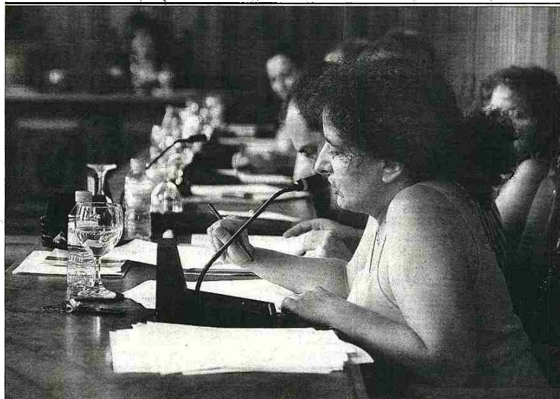
Imagen del Pleno celebrado ayer en el Ayuntamiento de Palencia.

Martín señaló que se ha realizado un importante trabajo en la erradicación de los núcleos chabolistas que existían en la capital. Así, recordó que tan sólo quedan las chabolas de La Tejera, ya que en los últimos años han conseguido la desaparición de las que existían en la Laguna Salsa, el Cementerio y Tarazona.