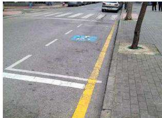
Una plaza para minusválidos en la calle Manuel Llanza de Mieres.