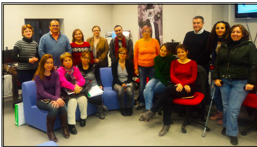
Foto "de familia" de la reunión del Observatorio celebrada el pasado 29 de febrero.

El 29 de febrero se celebró la segunda reunión del Observatorio de Prensa del proyecto en Jaén, que ya consolida la periodicidad de sus reuniones para el análisis de las informaciones discriminatorias aparecidas en la Prensa Local y sigue adelante con el calendario de colaboraciones establecidas para este año, en el que se dará cabida a todas las asociaciones comprometidas en el Proyecto.