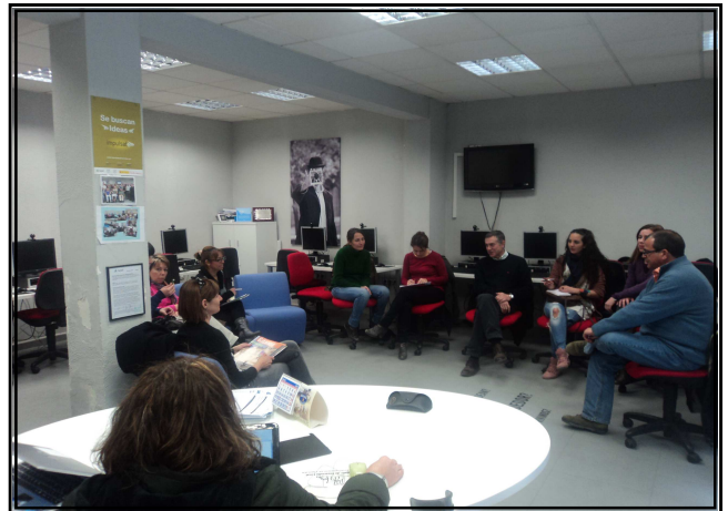
Un momento de la reunión del 29 de febrero.

Entre las cuestiones tratadas en la charla llamó la atención que el colectivo de personas con discapacidad, que integra el 9% de la población, tenga la consideración de “generador de poca información”, y que cuando es objeto de noticia, en el 70% de los casos se refleje en un contexto negativo. Tal vez la solución pase por un aumento del número de personas con discapacidad en los medios de comunicación.