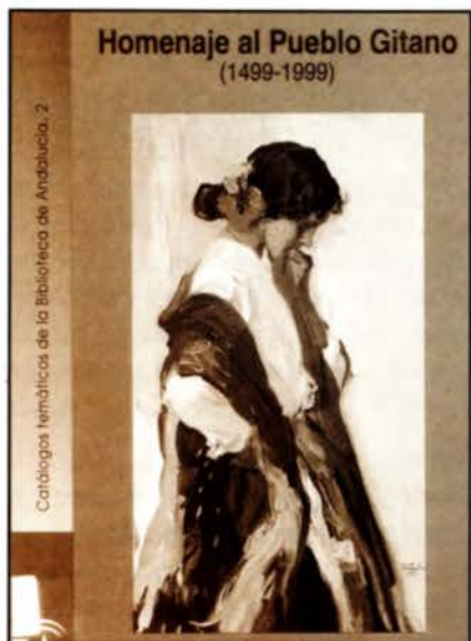
HOMENAJE AL PUEBLO GITANO (1499-1999) Biblioteca de Andalucía. Granada: Biblioteca de Andalucía, 1999.- 77 p.- (Catálogos temáticos de la Biblioteca de Andalucía; 2)

El pasado año, la Biblioteca de Andalucía organizó una serie de actividades bajo el lema del "Año de la memoria del pueblo gitano andaluz". Dada la naturaleza de esta entidad, uno de los productos resultantes ha sido un catálogo bibliográfico dedicado a la cultura del pueblo gitano. Este catálogo, dividido en dos grandes bloques temáticos ( Gitanos y Flamenco ), recoge un total de 270 referencias de libros y revistas, con ilustraciones de las portadas de muchos de ellos, así como un apartado final que incluye reproducciones de postales conservadas en esta biblioteca.