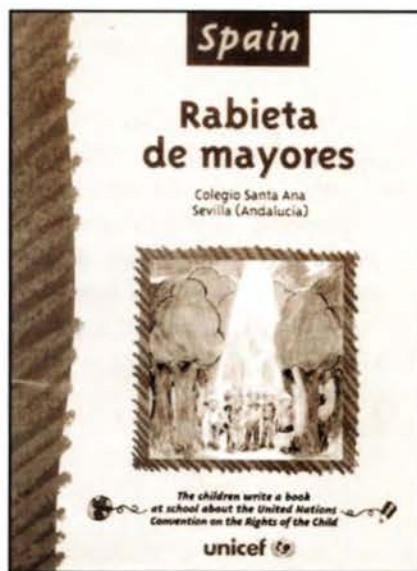
COLECCIÓN "LOS NIÑOS ESCRIBEN UN LIBRO EN LA ESCUELA" Barcelona: PAU Education, 1999.

Se trata de una colección de cuentos infantiles escritos e ilustrados por niños de diversas escuelas pertenecientes a los 191 países que firmaron la Convención de los Derechos del Niño, en los que expresan de forma creativa la percepción que ellos tienen de sus derechos. Estos cuentos están publicados en la propia lengua del país de origen de los niños, lo que puede resultar muy adecuado para explicitar la diversidad cultural. Los temas tratados se relacionan básicamente con sus derechos fundamentales: protección y amor, educación, tolerancia y solidaridad, igualdad e identidad. Algunos de ellos tratan situaciones problemáticas relacionadas con la infancia o que le afectan directamente: maltrato, explotación, trabajo infantil, emigración, conflictos bélicos, discriminación... mostrando en ocasiones las alternativas o las soluciones a estos problemas, como la adopción, el refugio, el apoyo institucional, la justicia. El cuento titulado "Rabieta de mayores (España. Colegio Santa Ana de Sevilla)" tiene como protagonista a un niño gitano y trata de manera muy adecuada el problema de la discriminación hacia este pueblo.