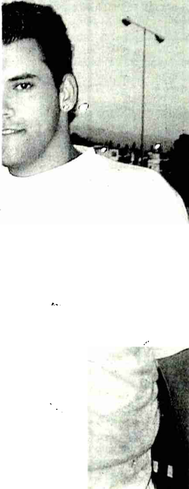
sede de Anaquerando. / A. G. P.