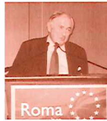
James D. Wolfensohn

El alto desempleo, en particular entre jóvenes, encierra a los gitanos en un círculo vicioso de empobrecimiento y exclusión, conduciéndoles cada vez más lejos de un nivel de vida normal y abandonando a muchos en asentamientos marginalizados, sin acceso a electricidad, agua limpia y otras necesidades básicas.