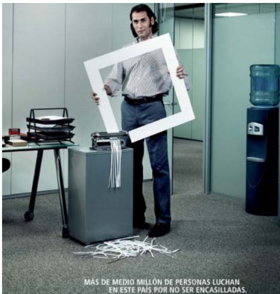
Cartel contra la discriminación de los gitanos en el trabajo.

Del 'fichaje étnico' de Silvio Berlusconi en Italia a la Primera Cumbre Europea sobre los Gitanos , auspiciada por la UE. Para mal o para bien, Europa empieza a reparar en su minoría étnica más numerosa y a preocuparse por la brecha que la separa del resto de sus ciudadanos. Según un estudio difundido en julio por Bruselas, entre 7 y 9 millones de gitanos siguen siendo las principales víctimas de la discriminación en Europa, o lo que es lo mismo, que lo tienen más difícil para acceder a un empleo o a una vivienda o que sufren exclusión en la educación, según el Observatorio europeo del Racismo y la Xenofobia.