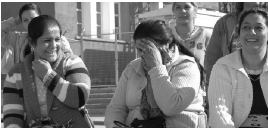
Secretariado Gitano Los gitanos, cada vez más 'disueltos' en la sociedad.

Por supuesto, no todo es de color de rosas en ese estudio. El trabajo se encarga de recordar datos como que aún el 4% de la población gitana vive sin agua corriente (el porcentaje en la población general se queda en el 0,3%) o que aún quedan prejuicios que eliminar a la hora de alquilarle la casa a un gitano, por ejemplo.